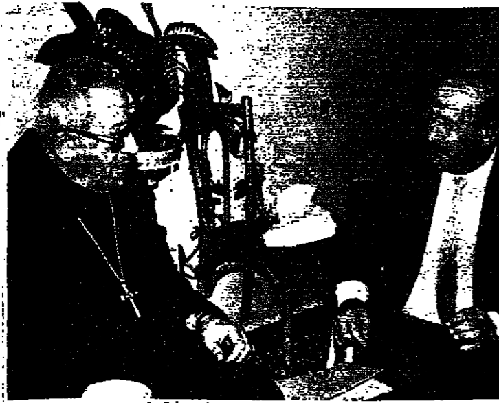
الإبائي الهاشم يتحدث في مؤتمر ميشال حرم